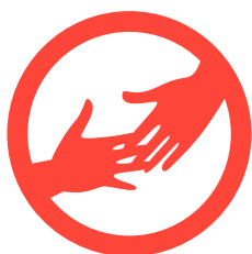
Supporto umanitario monocolore