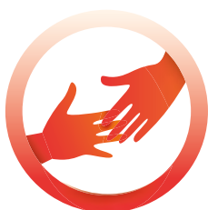
Supporto umanitario standard