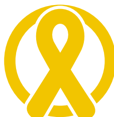
Cancro infantile monocoloro