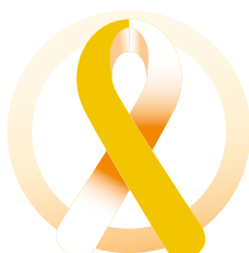
Cancro infantile standard