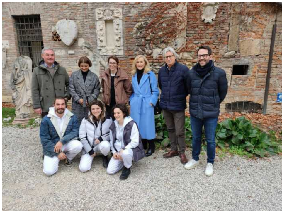
I giovani studenti di Engim Veneto che restaureranno le statue del giardino dell'Olimpico