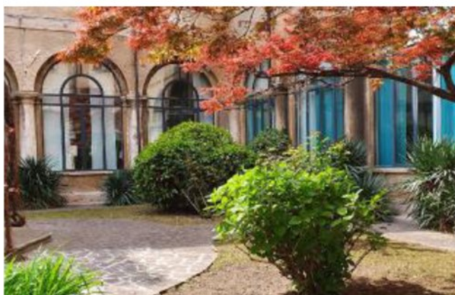
Palazzo San Giacomo Valorizzato il chiostro con il restauro del pozzo