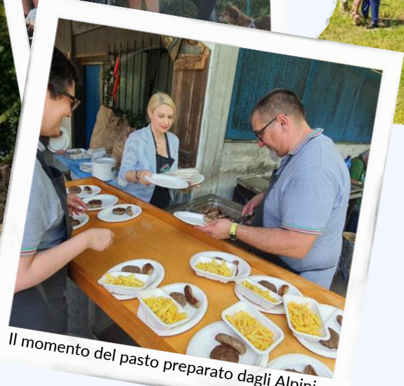
Il momento del pasto preparato dagli Alpini