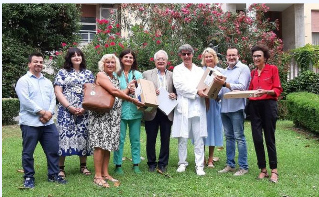
La consegna delle strumentazioni