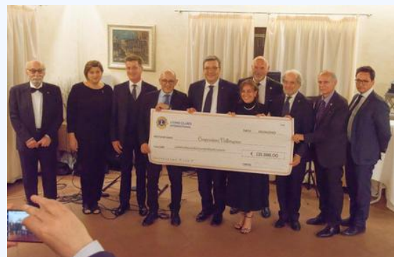
La consegna dell'assegno