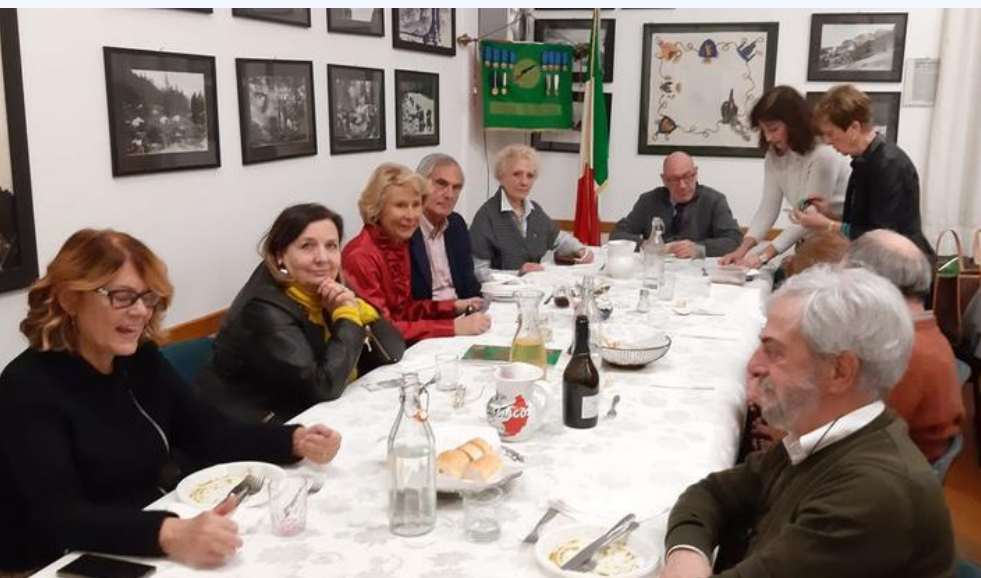
La lotteria durante la cena organizzata alla sede degli Alpini

La tradizionale generosità del nostro Lions club nei riguardi dell'ospedale Burlo Garofolo si è così arricchita di questa ulteriore iniziativa, oltre a quelle del passato, come le "poltrone per l'assistenza notturna" (vedi foto), l'allestimento di una "saletta-giochi" per i bambini operati (la stanza di Ondina), etc.