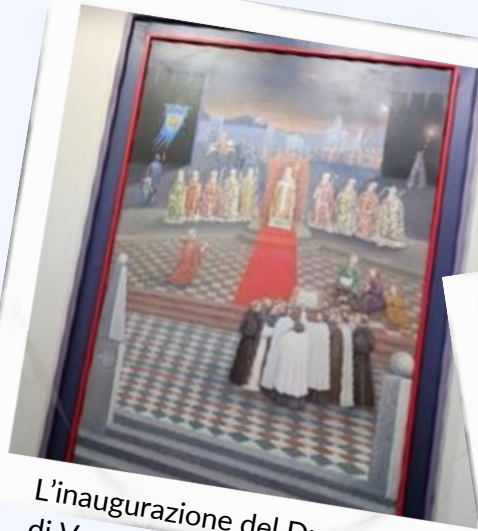
L'inaugurazione del Duomo di Venzone

Ha meritato sicuramente una visita, che è stata veramente interessante anche per la compagnia delle tante persone che abbiamo incontrato e delle relazioni che abbiamo intrecciato.