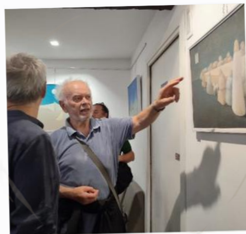
L'artista che illustra la sua "Ultima Cena"