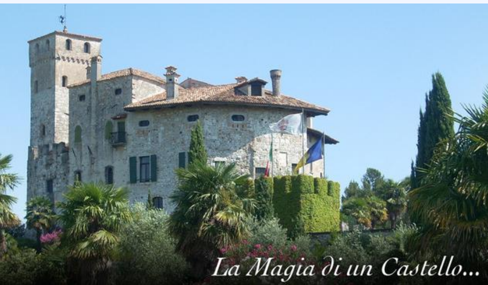
La Magia di un Castello...

Partecipare al Congresso Distrettuale di Apertura del Distretto 108Ta2, in programma domenica 24 settembre presso il suggestivo Castello di Villalta, rappresenta un'opportunità straordinaria di conoscenza, approfondimento, dialogo e amicizia.