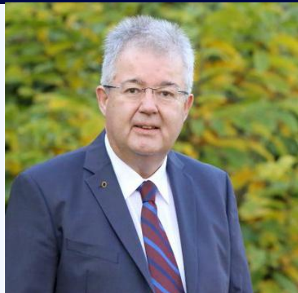
PID Walter Zemrosser Presidente del Forum europeo Klagenfurt 2023