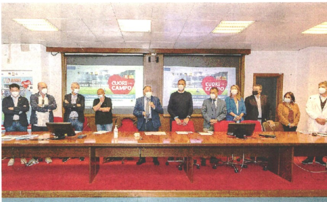
SOLIDARIETA' Un momento della presentazione del progetto "Cuori in campo"