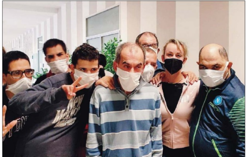
Istituti Polesani: giornata speciale dedicata alla pet therapy, con la consigliere regionale Cestari

ARTICOLO NON CEDIBILE AD ALTRI AD USO ESCLUSIVO DEL CLIENTE CHE LO RICEVE - 9612