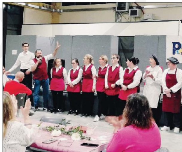
Lo staff dell'Osteria della Gioia