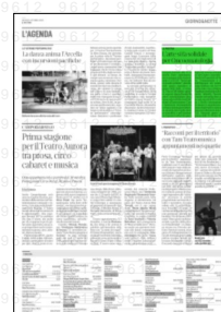
Superficie 5 %

ARTICOLO NON CEDIBILE AD ALTRI AD USO ESCLUSIVO DEL CLIENTE CHE LO RICEVE - 9612